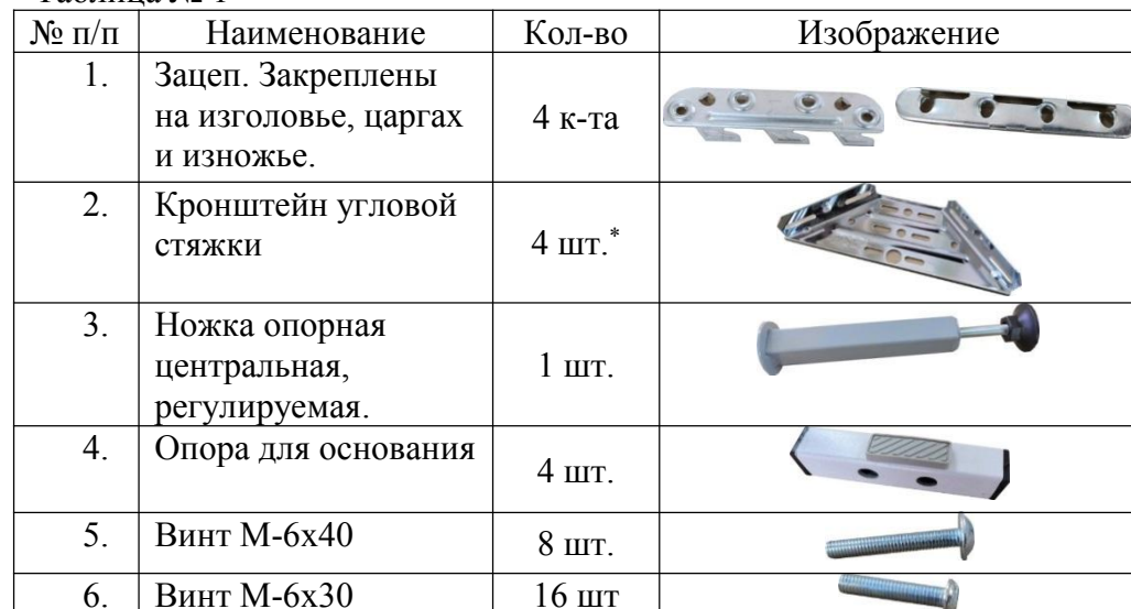
Таблица № 1

* для кроватей Floral, Insigne в комплект поставки входит 8 кронштейнов угловой стяжки и Винт М-6х30 – 32 шт.