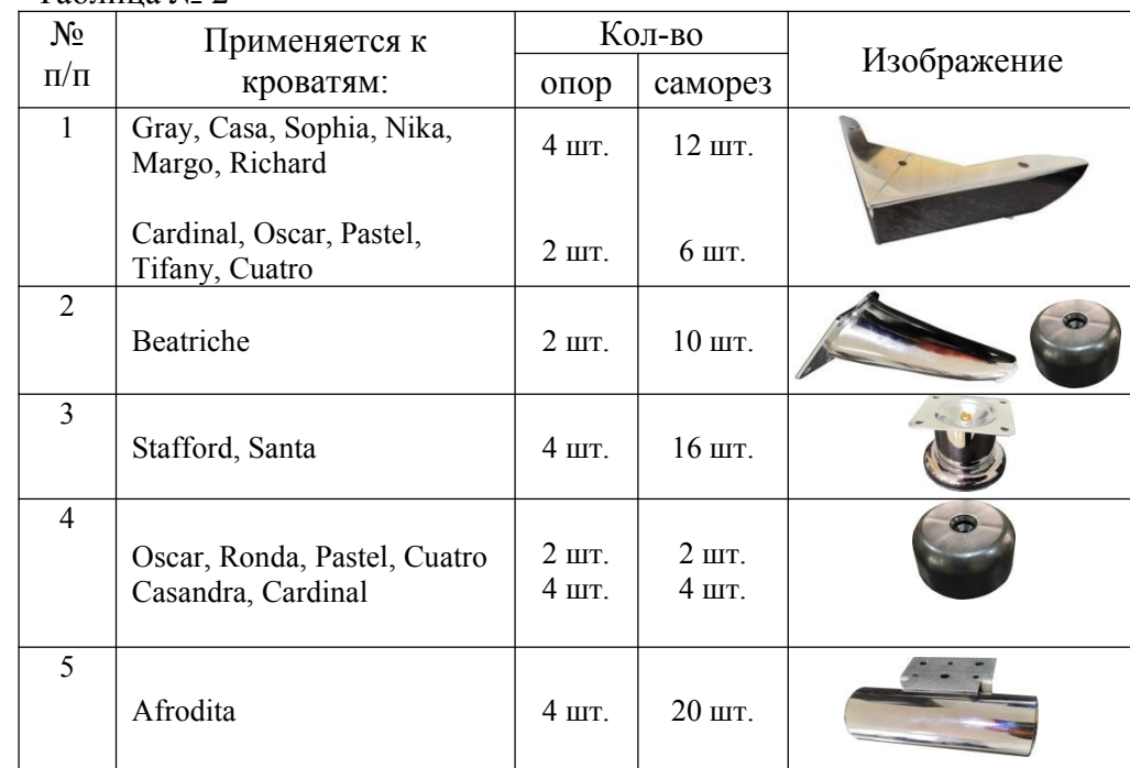
Таблица № 2